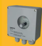
UTR termostat na zed' s vysokým krytím