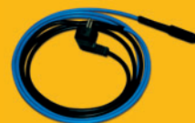
PPC - montážní sada automatický topný kabel s termostatem a vidlicí