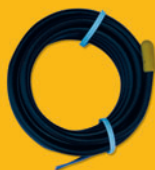
ST 111 teplotní kabelové čidlo