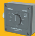
AZT prostorový termostat na zed'